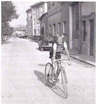
Massimo Bonini in bicicletta