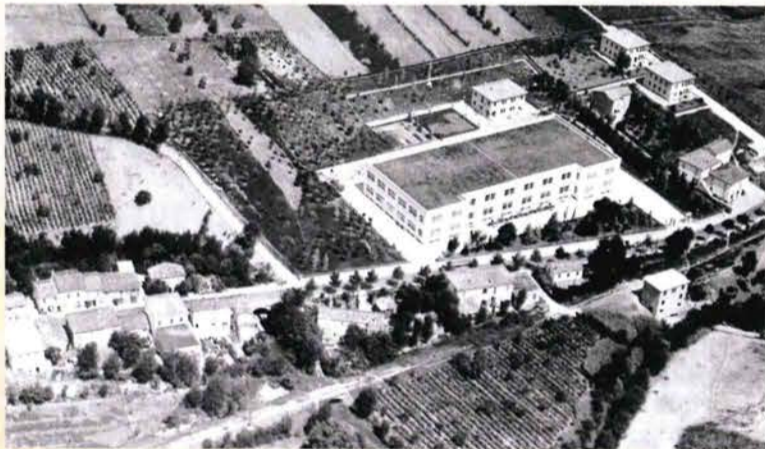
Cottonificio del Titano (fabricoun) e vecchio tracciato della ferrovia a Ponte Mellini negli anni '50